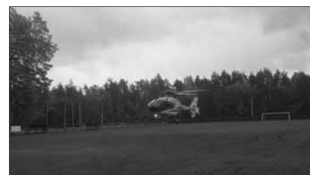
Lądowisko dla śmigłowca LPR Choczewo stadion LKS

Podsumowując okres od 15 września do 15 listopada 2011r. na terenie naszej gminy doszło do 6 zdarzeń tj. 5 miejscowych zagrożeń, w tym do 2 wypadków drogowych, w których uczestniczyły 3 osoby poszkodowane. Niestety jeden z tych wypadków okazał się tragiczny w skutkach, pomimo podjęcia działań ratowniczych nie udało się przywrócić czynności życiowych kierowcy pojazdu. Po prawie godzinnej resuscytacji lekarz Pogotowia stwierdził zgon. Pozostałe miejscowe zagrożenia związane były z usuwaniem powalonych drzew oraz przygotowaniem lądowisk dla śmigłowca Lotniczego Pogotowia Ratunkowego. Wystąpiło także 1 pożarów, a były to: pożar sauny w Gniewinie na ulicy Szkolnej do którego zostały zadysponowane 2 zastępy (GBA 2,5/16 i GCBA 6/32) JOT II OSP Choczewo.