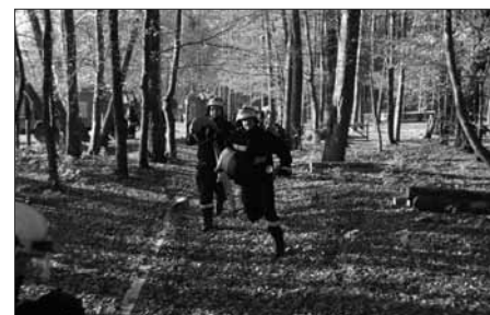
Ćwiczenia jednostek OSP z gminy Choczewo