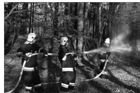
Ćwiczenia jednostek OSP z gminy Choczewo