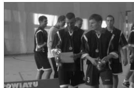
Linia turniej piłka halowa OSP